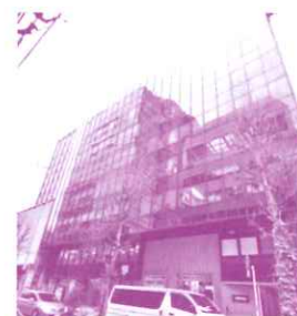
会場：横浜谷川ビルディング